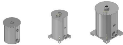
MAKA 200 MAKA 700 MAKA 1100